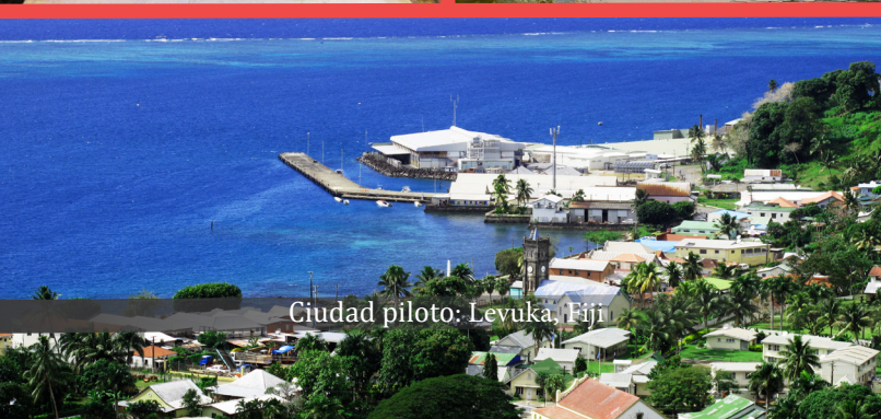
Ciudad piloto: Levuka, Fiji