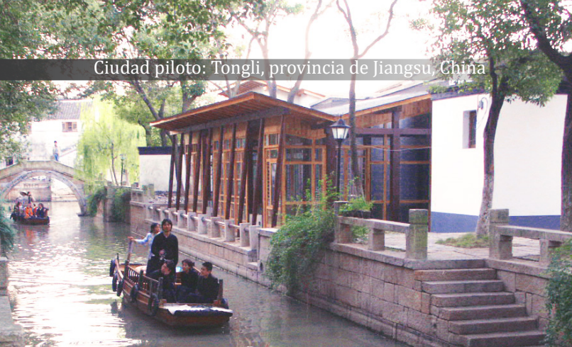
Ciudad piloto: Tongli, provincia de Jiangsu, China