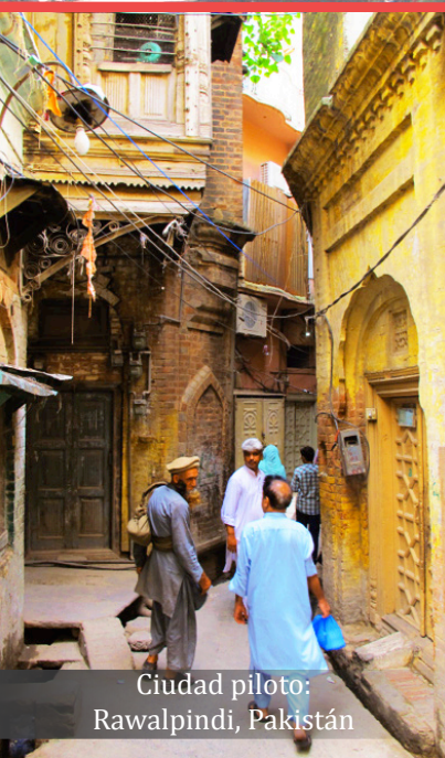
Ciudad piloto: Rawalpindi, Pakistán