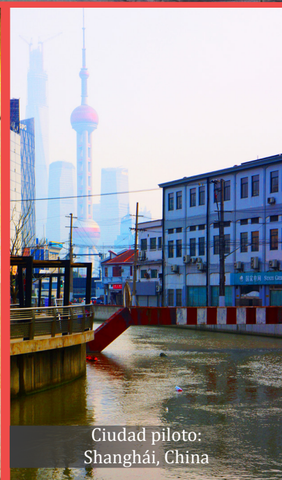
Ciudad piloto: Shanghái, China