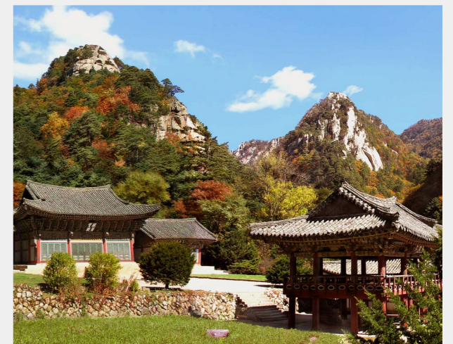
表训禅寺

这片土地令人震撼的自然之美，深刻体现在人文与山水的千年交融之中——那些与自然景观相映成趣的摩崖石刻、隐修庵堂、深山古刹，以及古往今来艺术家、诗人、修行者、朝圣者和寻常百姓在此获得的无穷灵感，至今仍在延续。从这里可以一览无余地眺望临近海岸线，这正是金刚山作为圣山的重要意义得以彰显的核心所在。