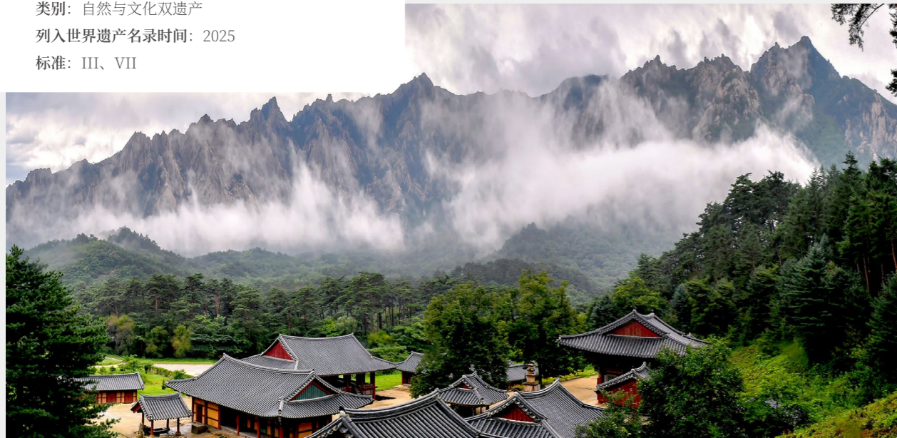
接云峰云瀑相映

国家：朝鲜民主主义人民共和国 类别：自然与文化双遗产 列入世界遗产名录时间：2025 标准：III、VII