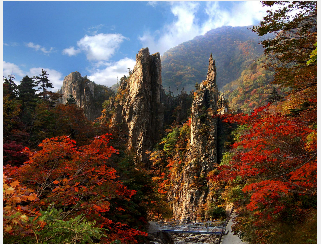
三孙奇岩

金刚山是一座圣山，见证了公元五世纪以来朝鲜半岛山岳佛教传统的历史传承。千百年来，佛教在此地的修行与实践，以及金刚山作为重要宗教圣地的历史地位，共同构成了其突出的普遍价值核心，展现了自然遗产与文化遗产密不可分的交融关系。现存的寺庙、庵堂、佛塔与石刻，以及受金刚山启迪而生的无数诗歌、画作与艺术作品，都生动体现了这一特质。这些建筑遗存，与延续至今的佛教